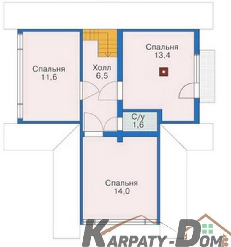
План мансардного этажа

Защищено пробной версией Visual Watermark. Полная версия не ставит это клеймо.