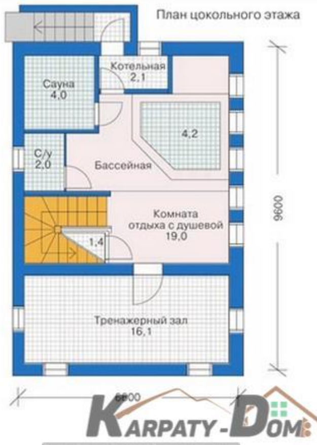
План цокольного этажа