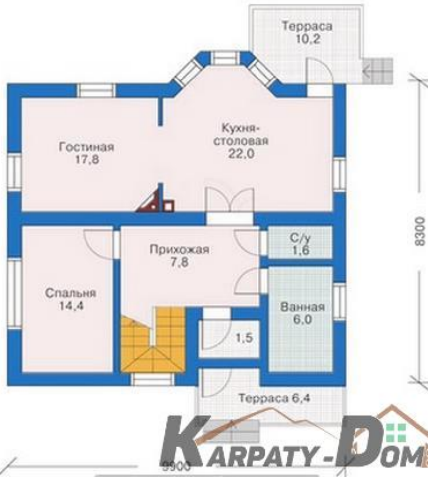
План мансардного этажа