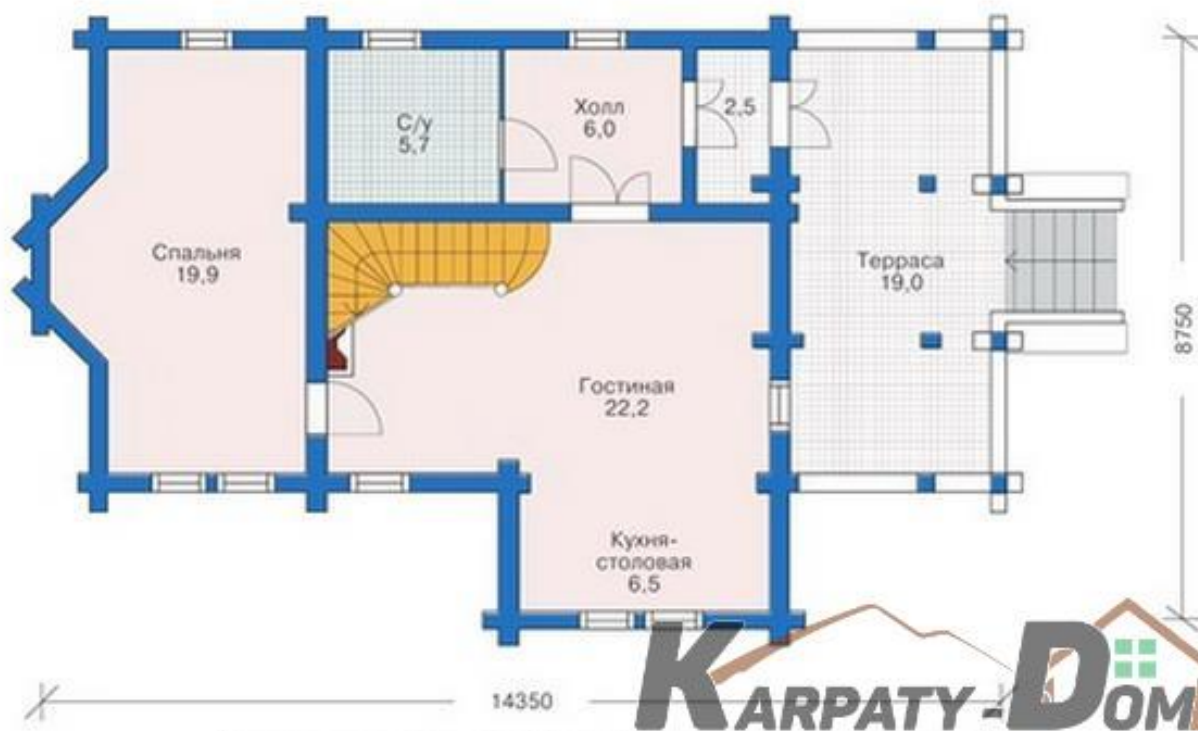
План первого этажа

Заказчик: пробная версия Visual Watermark. Полная версия не ставит этого текста.